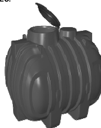
PROLUNGA MODULARE OPZIONALE (mod. PP77)