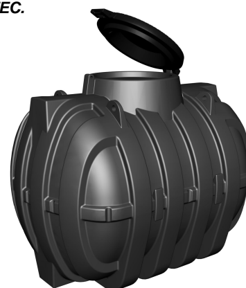
PROLUNGA MODULARE OPZIONALE (mod. PP77)