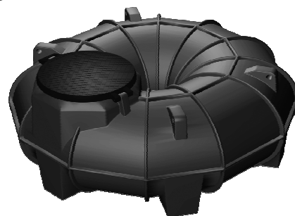
PROLUNGA MODULARE OPZIONALE