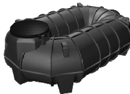
PROLUNGA MODULARE OPZIONALE