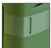
Maniglie laterali e posteriore per facilitare la movimentazione