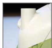
Condotta di sfiato