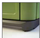
Base rialzata per movimentazione con forche + incavi per trasporto con carrello