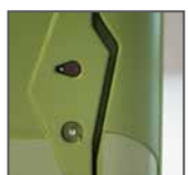
Chiavistello con segnalazione libero/occupato + chiusura con chiave