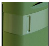
Maniglie laterali e posteriore per facilitare la movimentazione