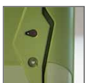
Chiavistello con segnalazione libero/occupato + chiusura con chiave