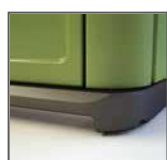
Base rialzata per movimentazione con forche + incavi per trasporto con carrello