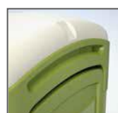
Finestrelle per areazione

Colori: Verde (RAL simil 6025), Blu (RAL simil 5017), e Grigio (RAL simil 7037) standard; altri colori su richiesta; possibilità di personalizzazione.