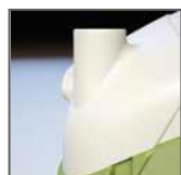
Condotta di sfiato