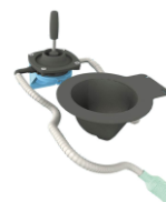
OPTIONAL Kit ricircolo per il risciacquo del vaso