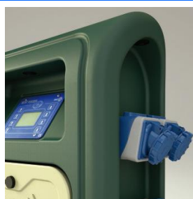
Prese interbloccate su entrambi i lati