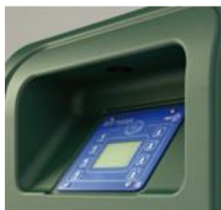
Display di lettura transponder