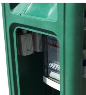
Quadro di protezione interno IP65