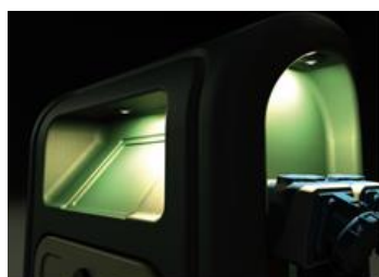
Illuminazione led sul lato frontale e su quelli laterali